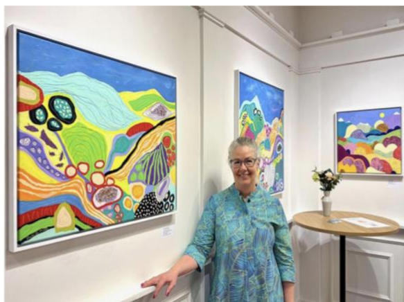
Äldre bild från tidigare utställning.