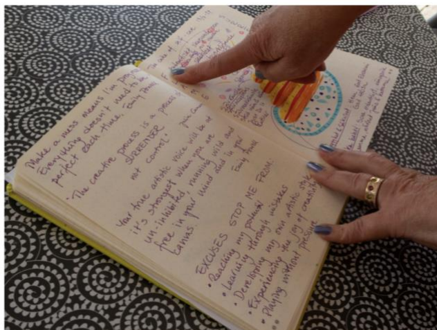
Att jobba kreativt behöver inte bara vara i ateljén.

- Lev kreativt för att hitta kreativiteten. Det finns gånger jag tvivlar och känner att inget går min väg. Men jag tror aldrig att jag träffat en konstnär som inte haft tvivel. Det är viktigt att ta sig igenom tvivlet och fortsätta göra det man tycker är kul. Kreativiteten flödar i led med den personliga utvecklingen. Man får träna på att släppa egna "regler" på hur saker ska gå till, eller hur mycket man borde producera.