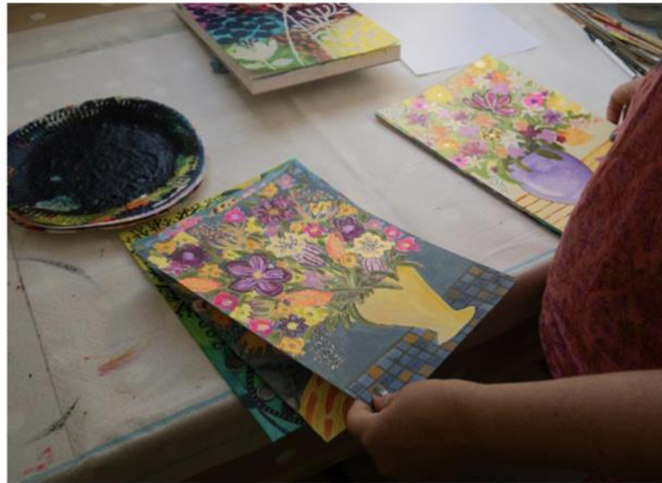
Små tavlor som stora.

-Det är viktigt för mig att ha kul när jag målar, annars låser sig processen. När jag tänker att det ska bli en bra tavla, så blir det oftast inte det. Det är när jag låter inspirationen ta över och när jag följer mina känslor och färgglädjen som resultatet blir bäst.