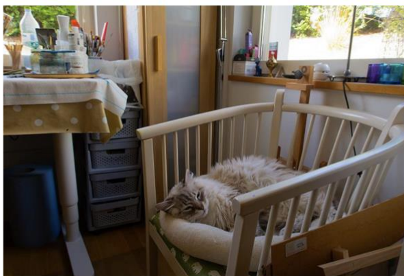
Katten Kasper är den enda som får iakttä Ankis kreativa process i ateljén.

Sedan Anki började med måleri på allvar 2019, har hon blivit mer tacksam. Hennes svåra tider med sin sjuka man fick henne att bli tacksam till livet och tillgången till måleriet. Hon har haft regelbundna utställningar sedan dess och som exempel deltar hon med andra Lidingökonstnärer på den årliga Vårsalongen i stadshuset. Nu vill Anki fortsätta dela denna glädje av färg och form med Lidingöborna.